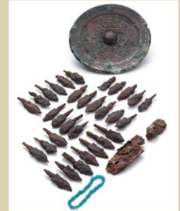
津古生掛古墳 出土品