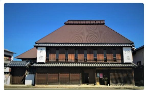
はたごあぶらやをしらべる (160年くらい前)