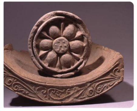
かわらをしらべる (1300年くらい前)