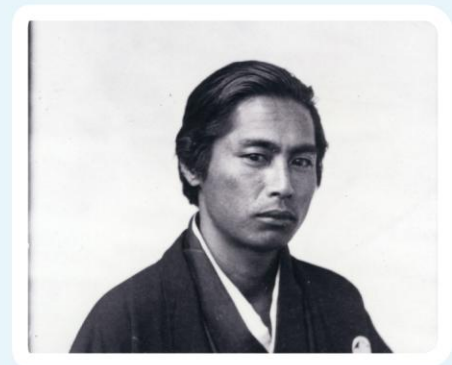
たかまつりょううんをしらべる (150年くらい前)